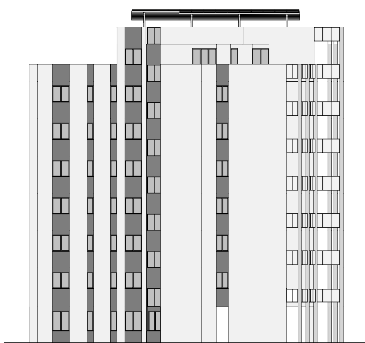
PROSPETTO NORD 1:200