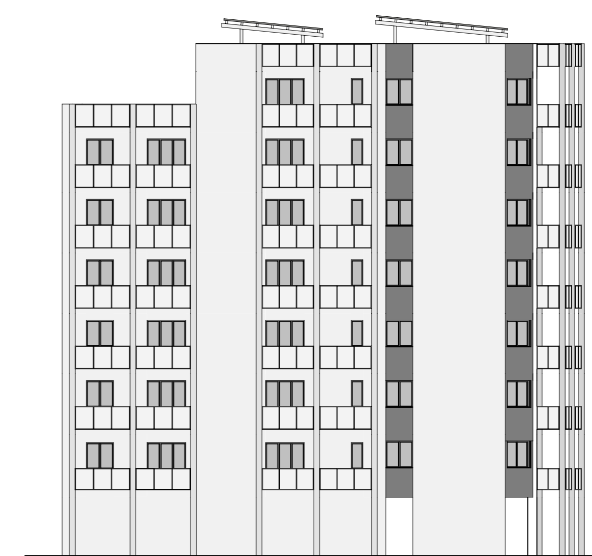
PROSPETTO OVEST 1:200