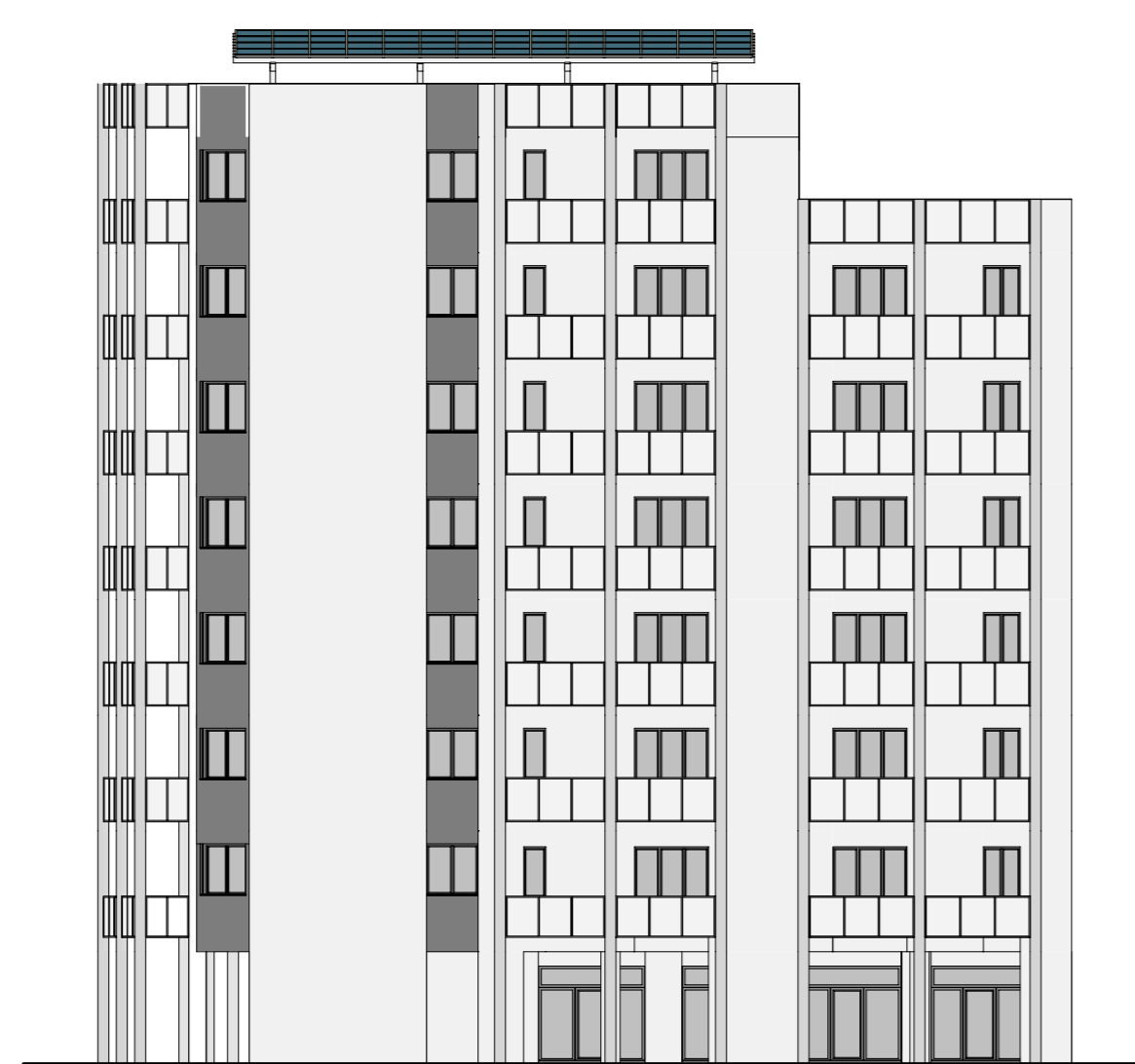
PROSPETTO SUD 1:200