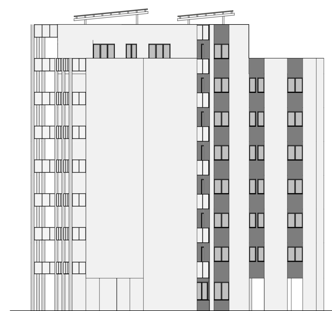
PROSPETTO EST 1:200