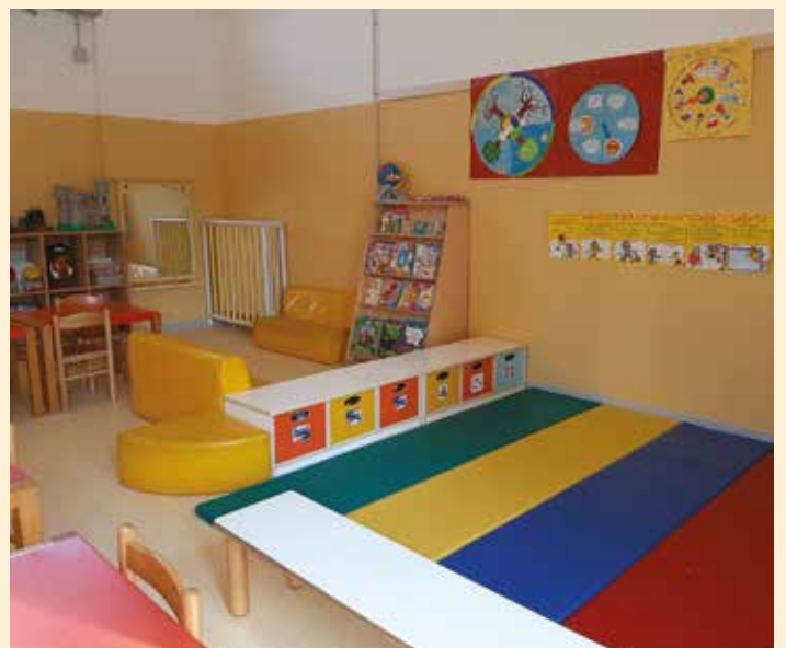
Alcuni particolari delle aule