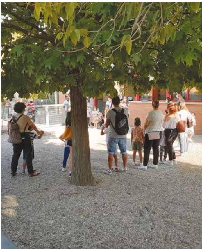
Inizio anno scolastico Accoglienza delle classi prime alle elementari Ciari

menta, con un originale e ironico gioco di parole, che sono "pro-no", ovvero servile, al Green Pass. L'account che ha ricevuto la circolare dalla conoscente posta un altro messaggio in cui mi identifica come "un bel dirigente" da segnalare al Ministero perché nel mio account farei "propaganda omo", taggandomi, ovviamente, per farmi sapere di essere identificato. Amareggia che qualcuno, sicuramente non rappresentativo ma comunque membro di una comunità di cui faccio parte da ormai dieci anni e in cui penso sempre di aver promosso il dialogo, non trovi di meglio che inviare un documento protetto da user e password, incitando all'odio, invece che scrivere una semplice mail chiedendo chiarimenti.