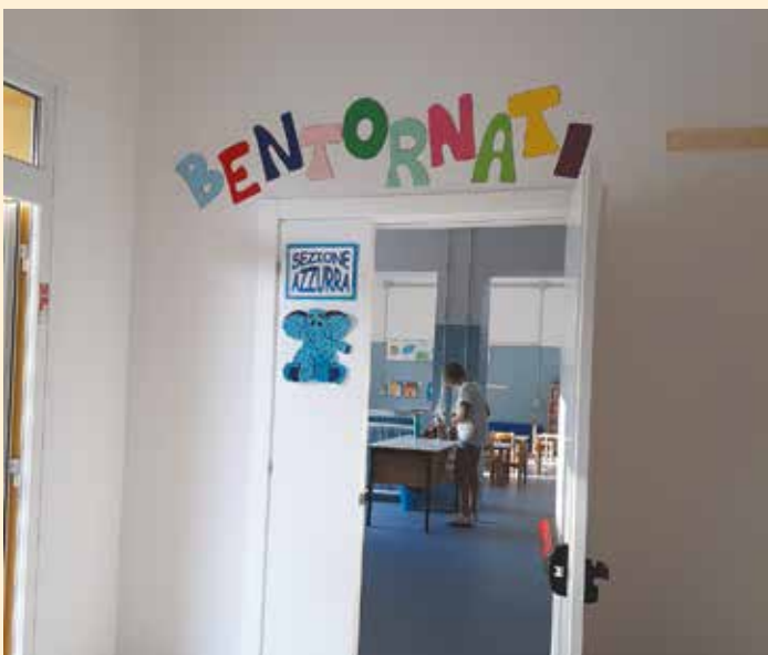
Alcuni particolari delle aule