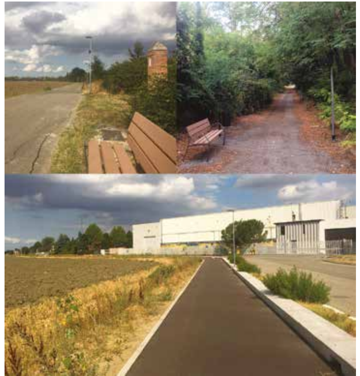
Alcuni tratti della ciclovia