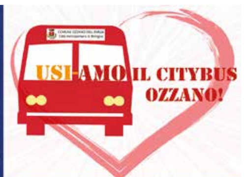
Nuove linee 131 e 132, orari, percorsi, tariffe e agevolazioni http://www.comune.ozzano.bo.it/notizie/ozzano-13-settembre-2021-e-partito-il-nuovo-servizio-citybus-linee-131-e-132-tpcr