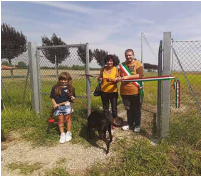
Taglio del nastro dell'area di sgambamento cani a Ponte Rizzoli.