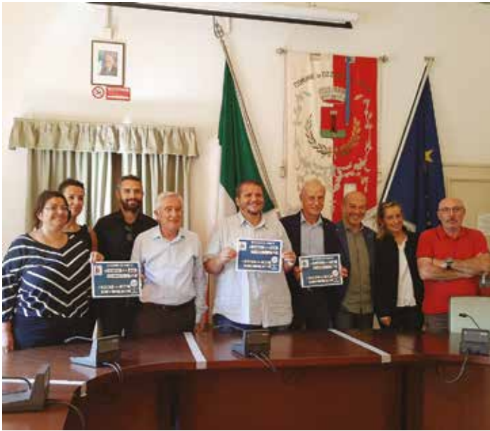
Presentazione del progetto di collaborazione fra la Pallavolo femminile Ozzano e la Geetit Pallavolo maschile Bologna