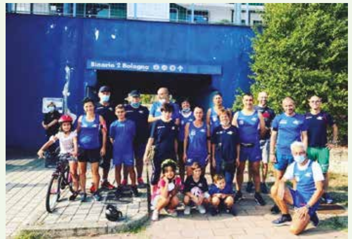
Il gruppo podisti ozzanesi che hanno partecipato all'inaugurazione della ciclovía stazione SFM - Ponte Rizzoli