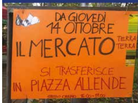
Dal 14/10/2021 al 28/4/2022 il Mercato contadino Terra Terra di Ozzano si trasferisce in Piazza Allende