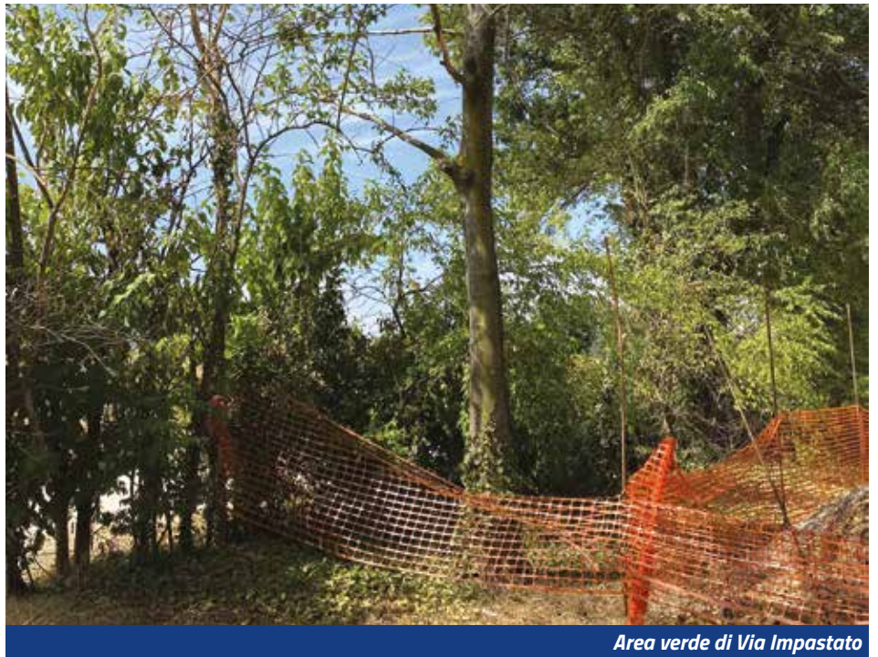
Area verde di Via Impastato

l'intervento, ha presentato la richiesta di permesso di costruire. A quel punto abbiamo valutato che fosse opportuno non densificare troppo l'area su cui volevano (e potevano) costruire proponendo loro di scambiare l'area di un fabbricato (1.870 metri quadri di area complessiva, peraltro boscati con una quarantina di piante e alberi già grandi che diventeranno un piccolo parco pubblico) con un'area di proprietà comunale (di complessivi 3.200 metri quadri attualmente prato e orti comunali, orti che saranno realizzati nuovamente nelle immediate vicinanze) in Via Mattei. A fronte della differenza dimensionale delle due aree viene corrisposta una contropartita in opere pubbliche di 150.000 euro più Iva e un alloggio di quelli che saranno realizzati sarà concesso al Comune (per una famiglia che sarà individuata con avviso pubblico) a canone calmierato per almeno dieci anni. Va detto che nell'area di Via Mattei sono presenti 2 (due) alberi che cercheremo comunque di preservare ma non si può certo dire che si costruisca "nel