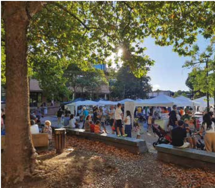
Evento "Ozzano in Piazza": gli stand dei commercianti in Piazza Allende