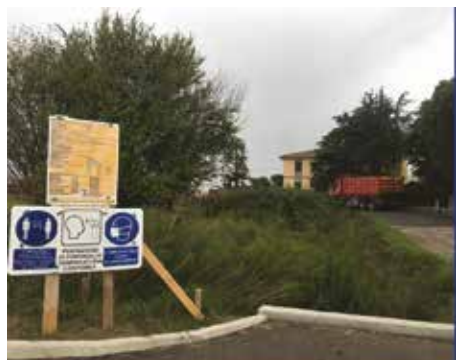
Intervento di asfaltatura di Via Tolara di Sotto in località Osteria Nuova, in corso nel mese di ottobre

Inoltre, in questi anni abbiamo cercato, e ricerchiamo, di cogliere opportunità per poter attingere anche a risorse extra bilancio comunale in aiuto all'attuazione del programma di mandato e alla presa in carico di esigenze e necessità del territorio candidando i nostri progetti ai bandi in pubblicazione. Diverse volte abbiamo ottenuto fattivi e importanti contributi economici; questo è segnale anche di coerenza tra le nostre politiche e azioni locali di mandato e le politiche metropolitane, regionali, nazionali e comunitarie. Il buon operato poi dei funzionari comunali anche nell'impegno al successivo monitoraggio e alla rendicontazione di tali contributi è garanzia che tali risorse siano effettivamente riconosciute al nostro Ente; è una parte del lavoro che non si vede ma che è altrettanto importante e collegata strettamente ai risultati sul territorio.