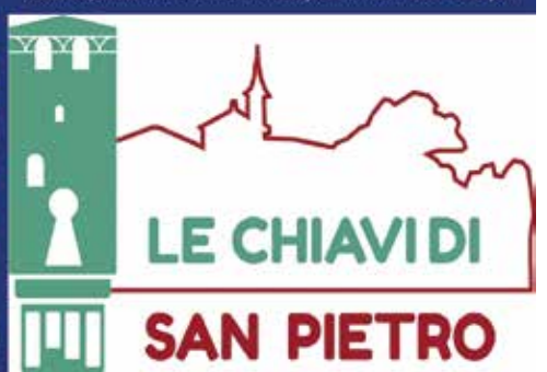
SAVE THE DATE! 24 ottobre 2021 evento Percorso partecipato "Le chiavi di San Pietro"