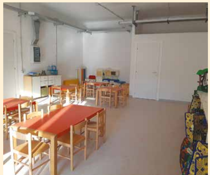
Alcuni particolari delle aule