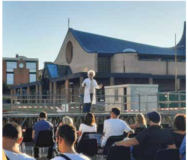
Evento "Ozzano in Piazza": lo spettacolo del comico Paolo Migone